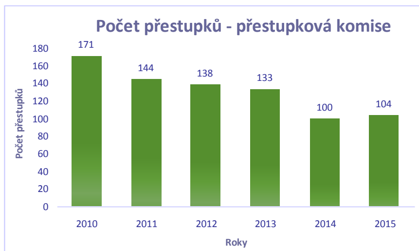
Graf 1 Rozbor přestupkové činnosti