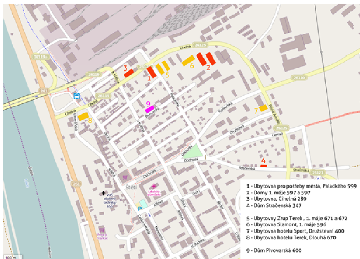
Mapa 1: Přehled SVL a dalších problematických lokalit v rámci Štětí (výřez)

Město Štětí v přihlášce identifikuje celkem šest sociálně vyloučených lokalit, z toho čtyři v samotném Štětí, jednu v místní části Počeplice a jednu v místní části Radouň. Již při pohledu na mapu je zřejmé, že tři identifikované lokality (Ubytovna pro potřeby města, Palackého 599, objekty 1. máje 597 a 1. máje 598 a ubytovna Cihelná 289) jsou koncentrovány v severním cípu obytné části města a navazuje na ně areál papírenského závodu. V těsném sousedství se navíc nacházejí další dvě ubytovny (1. máje 671 a 672) a dům 1. máje 596, který je také částečně užíván k bydlení. Tyto domy nejsou hodnoceny jako „vyloučené“, ale také zde bydlí v menším počtu jednotlivci, kteří nedosáhnou na jinou formu bydlení (viz Mapa 1 a Mapa 2).