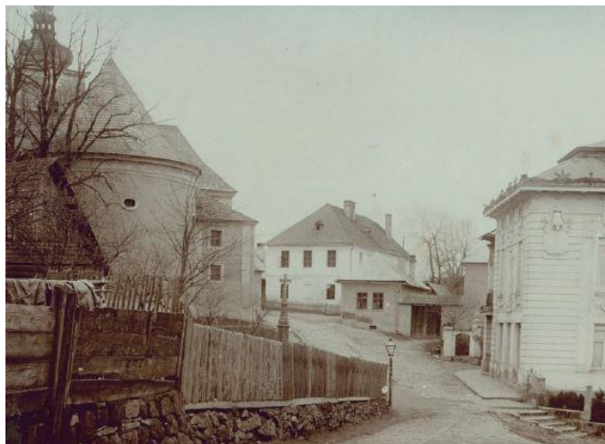
Fara, kostel, Bratmannova vila