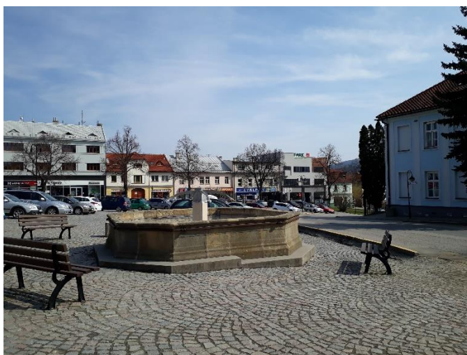
Horní strana náměstí s kašnou, pohled na S-V stranu náměstí s parkováním - 2017