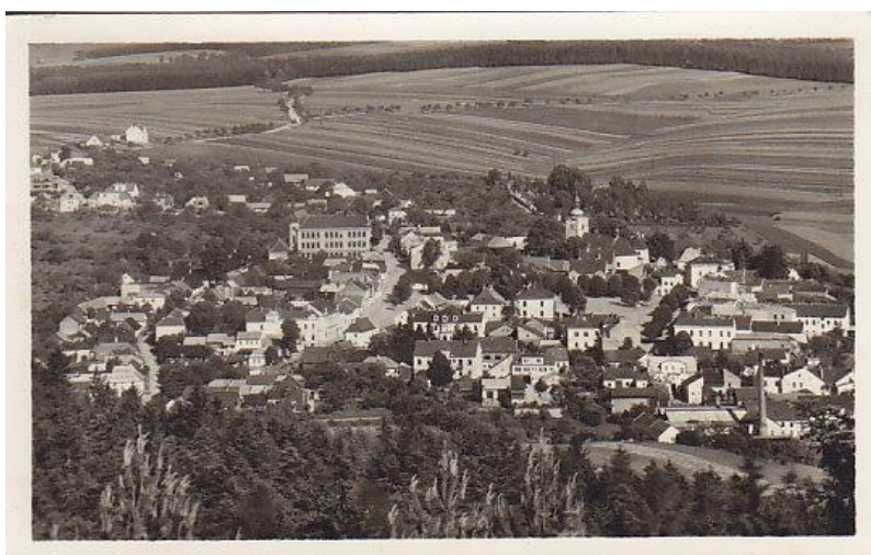
Celkový pohled 30. léta – patrný rozsah zástavby před válkou