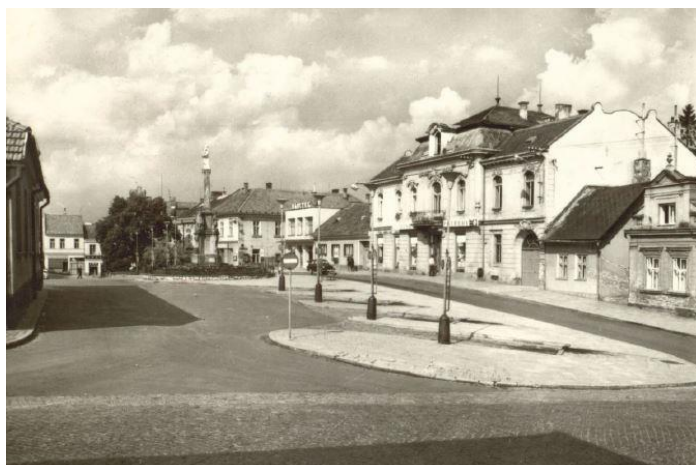
Masarykovo náměstí -70. léta s Mariánským sloupem a patrným dopravním řešením