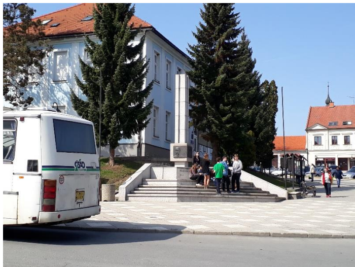
Památník Masarykovo náměstí