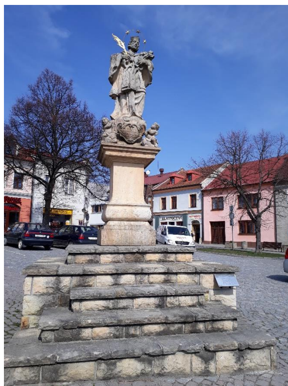
Sv. Jan Nepomucký - 2017