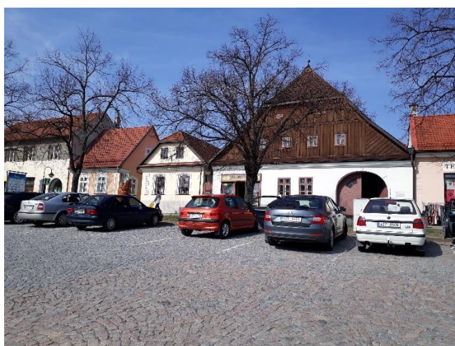
S-Z strana náměstí – 2017