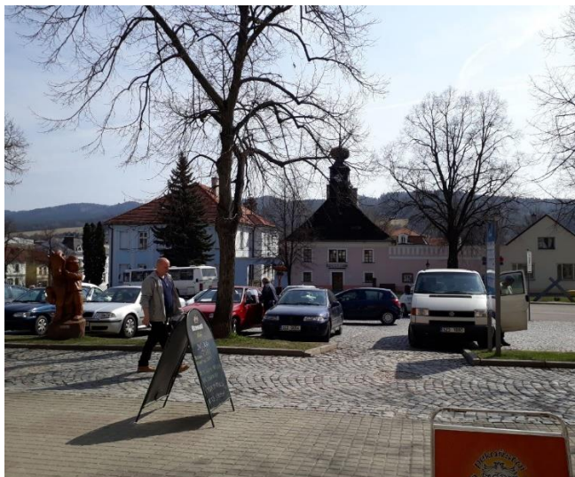
Diagonální komunikace s parkováním, přetínající náměstí – 2017