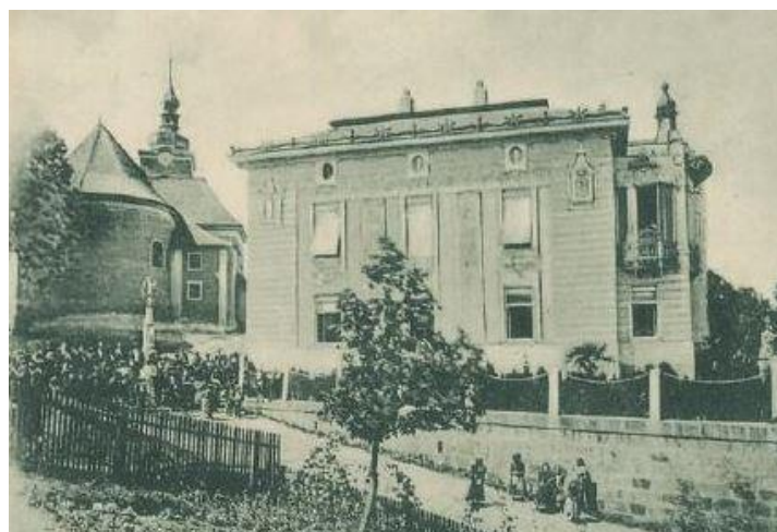
Bratmannova vila č. p. 116, kostel – počátek 20. století