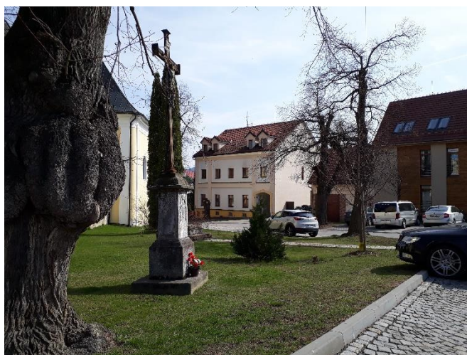
Parčík s křížem u kostela – 2017