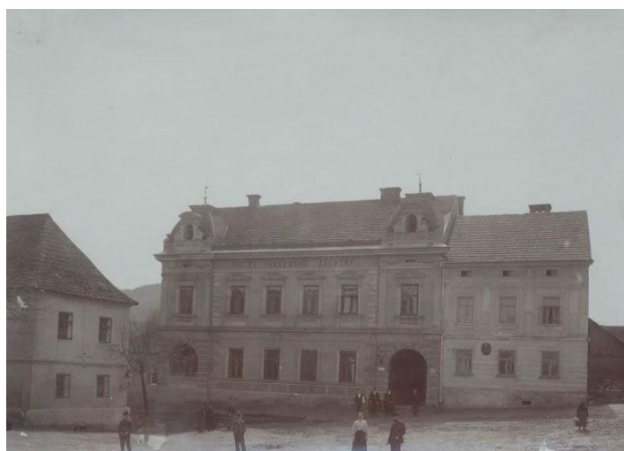
Červený dům, Beseda Dobrovský