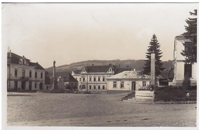
Masarykovo náměstí - 30. léta 20. st.