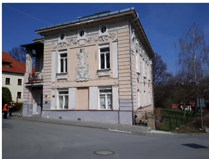
Bratmannova vila č. p. 116, 2017