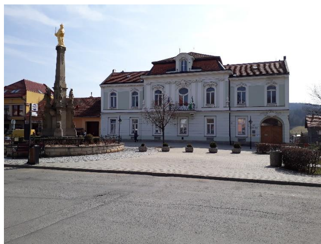
Městský úřad č. p. 189, s Mariánským sloupem - 2017