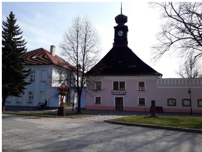
Muzeum (dům č. p. 276) – 2017