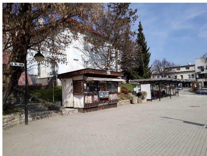
Zastávka autobusů, náměstí – pod muzeem -2017