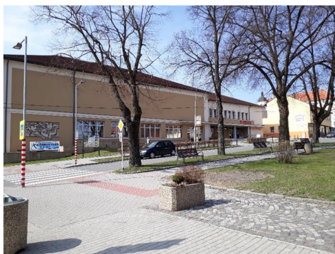
J-Z strana náměstí – Kulturní dům – 2017