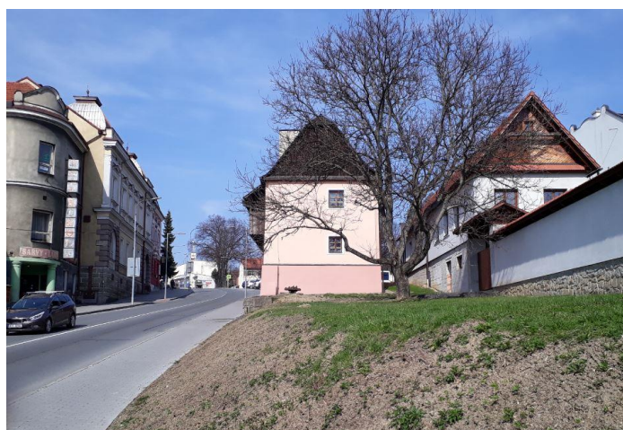
Červený dům č. p. 194, 2017