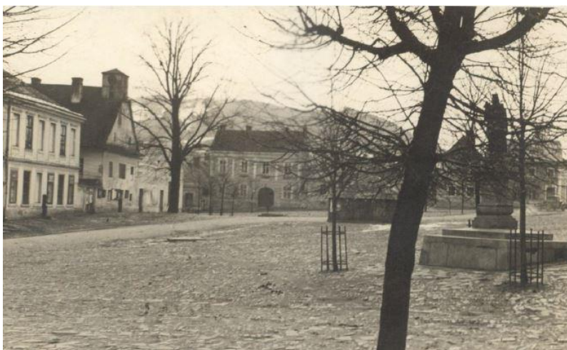
Náměstí se sochou sv. Jana Nepomuckého a kašnou historický pohled