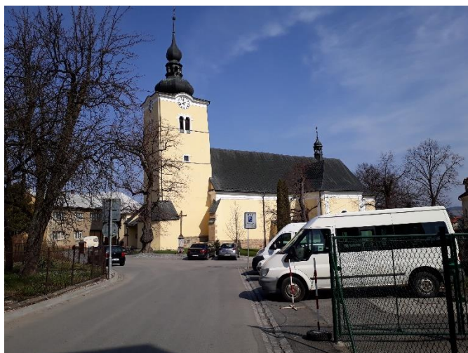
Kostel Povýšení sv. Kříže - 2017