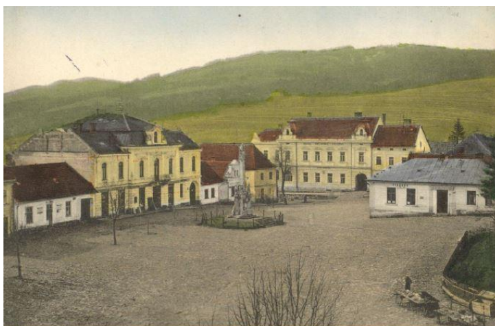
Masarykovo náměstí s Mariánským sloupem – počátek 20. století