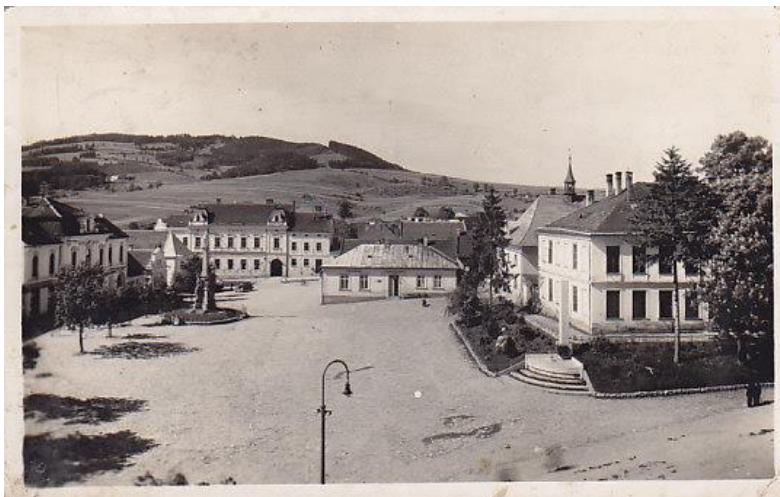
Masarykovo náměstí – úprava 30. léta 20. st.