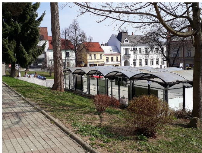
Nástupiště autobusů, pohled od muzea - 2017