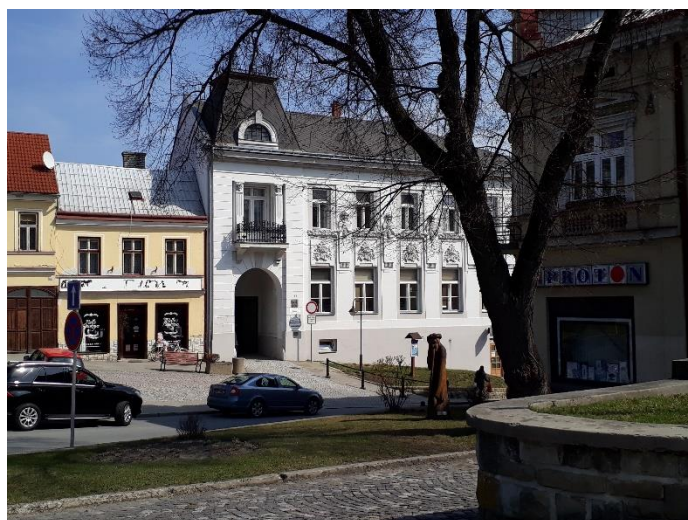
Výjezd z náměstí (kolem domu „U Slunce“) -2017