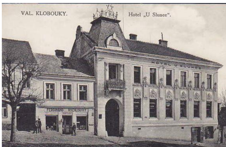
Hotel „U Slunce“, náměstí 1929, č. p. 177