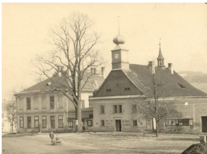
Radnice, dům č. p. 276; 20. léta 20. století