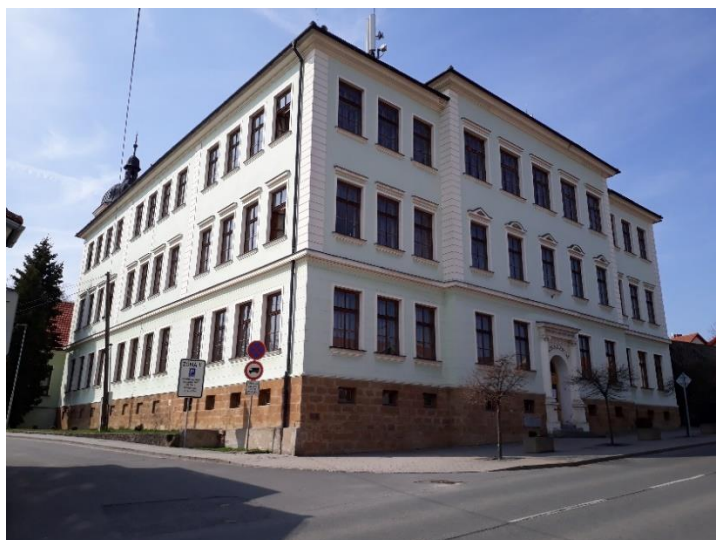
Gymnazium – 2017